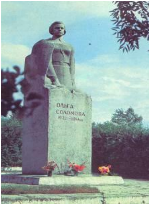
Помнік В. Соламавай на яе радзіме ў в. Лаіша

Камітэт камсамола неаднаразова паступалі просьбы накіраваць яе на фронт або ў тыл ворага. У адным са сваіх пісьмаў яна пісала: “Я не могу быць в стороне от той борьбы, какую ведут наши доблестные солдаты и героические белорусские партизаны с врагом...”